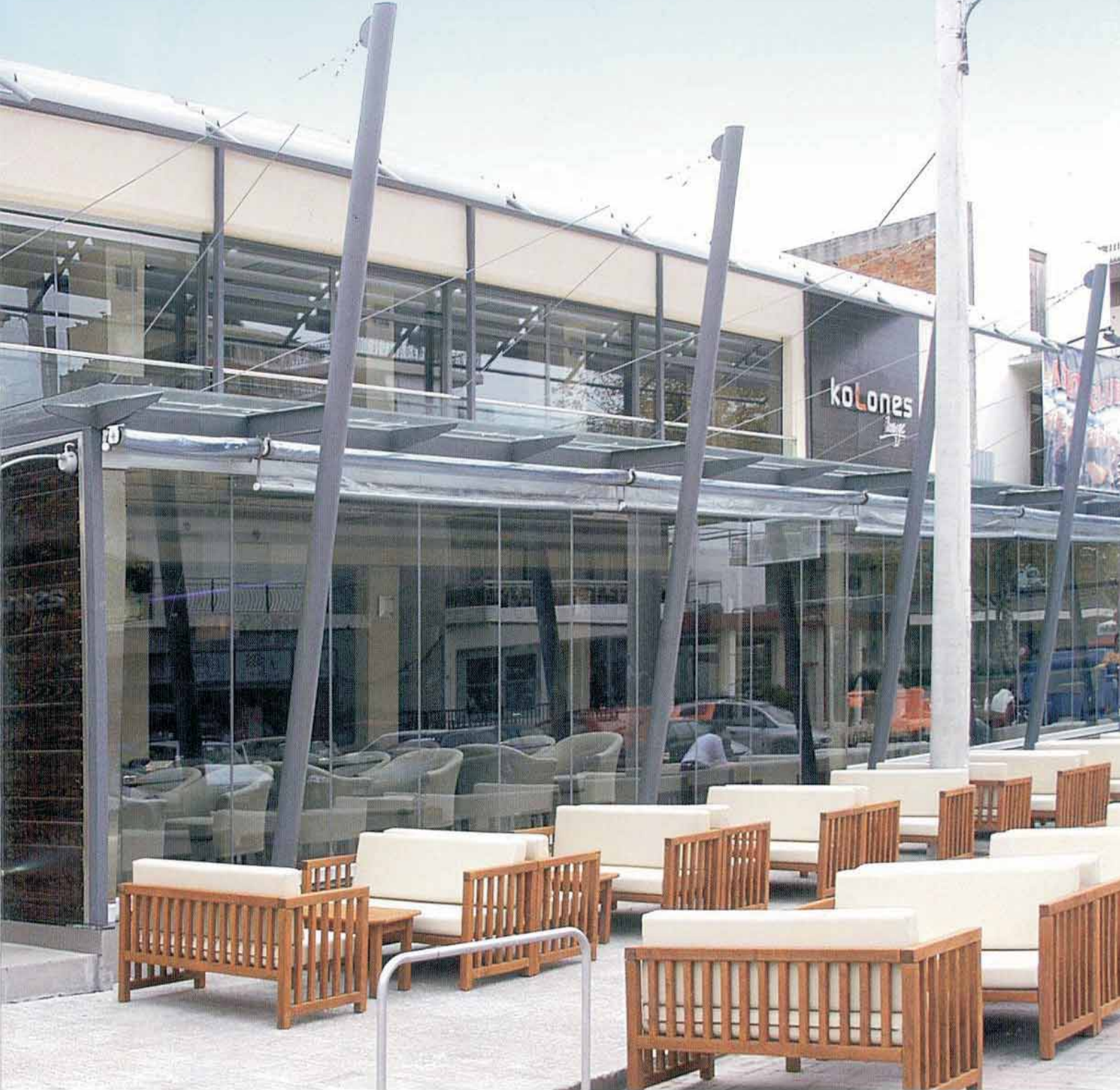
EGY KÁVÉHÁZ A SÉTÁLÓ UTCÁN