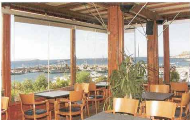
TENGERRE NÉZŐ ÉTTEREM