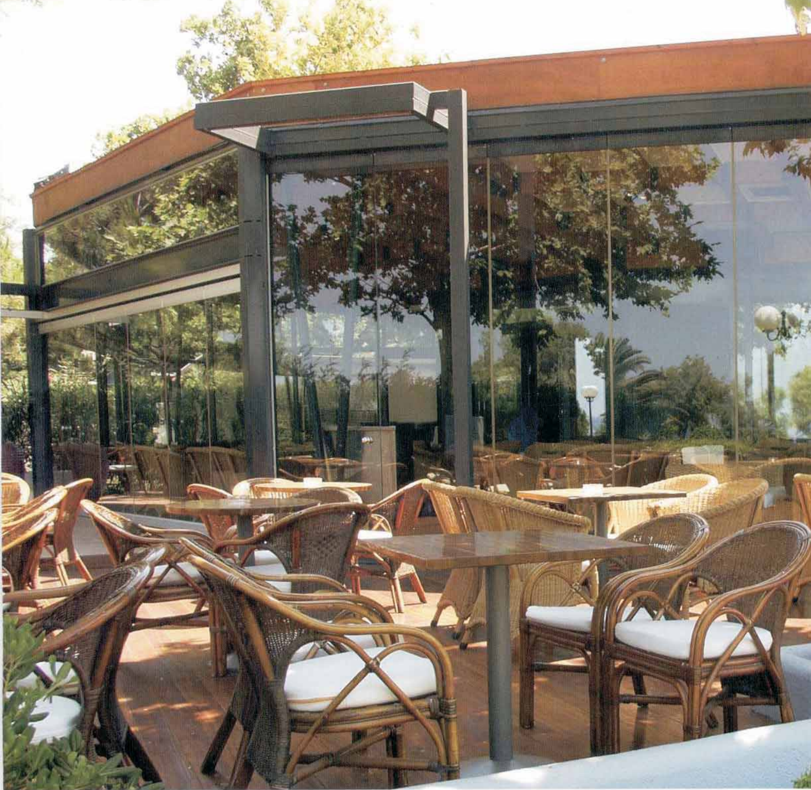
ELTOLHATÓ ÜVEGFAL ÉTTERMEMOBIL